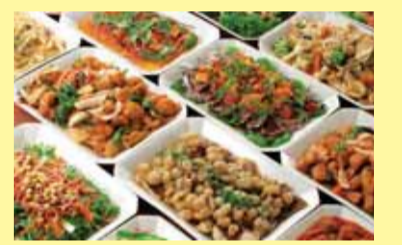
自助餐餐廳 (200個坐位)