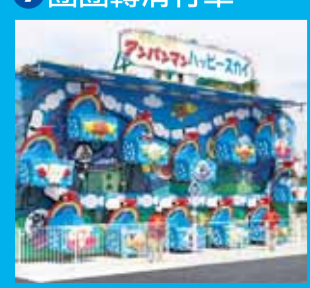
13 麵包超人快樂天空