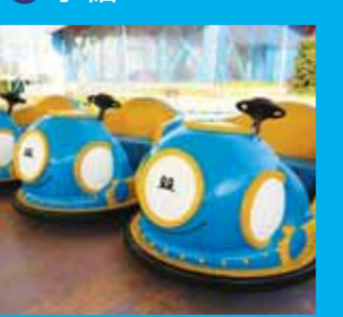
9 丹潛水員, 高! 高! 卡丁車