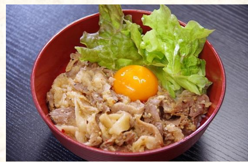
①⑨ イノブタ丼 1200 円

しらすの老舗「湯浅前福」の釜揚げしらすと老若男女に人気のネギトロが1つになったお得なメニュー！