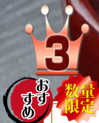
①⑥ 海鮮丼 1400 円