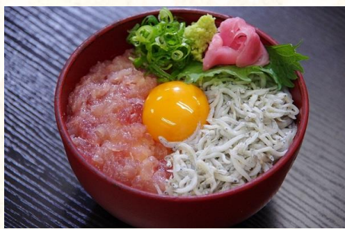
①⑧ 釜揚げしらすとネギトロの二色丼 1200 円

しらすの老舗「湯浅前福」の釜揚げしらすと老若男女に人気のネギトロが1つになったお得なメニュー！