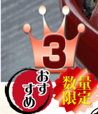
①⑥ 海鮮丼 1500 円