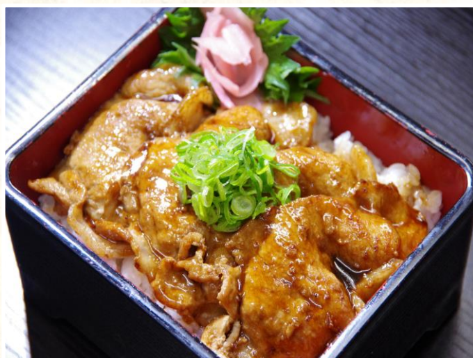
①⑨ 熊野ポーク重 1300 円

「足赤海老」、「太刀魚」、「南高梅」、「ハナビラダケ」など地元の食材をふんだんに使ったおすすめのメニュー！