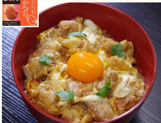
①⑦ 紀の国みかندりの親子丼 1100 円